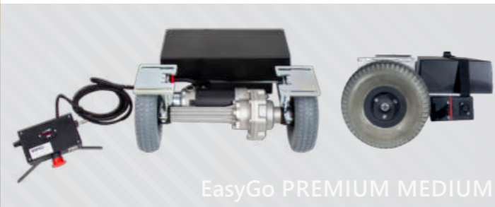
EasyGo PREMIUM MEDIUM